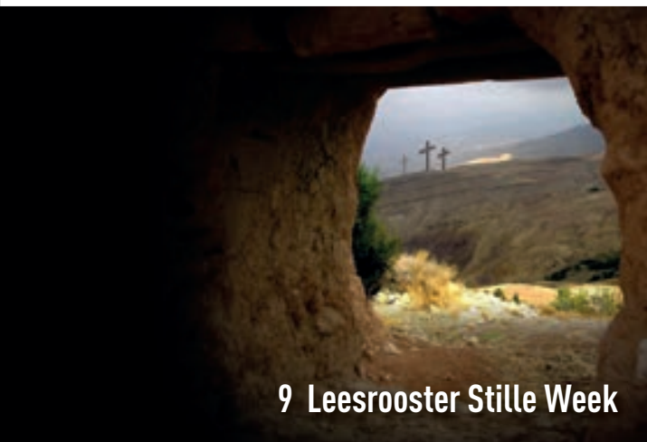
9 Leesrooster Stille Week